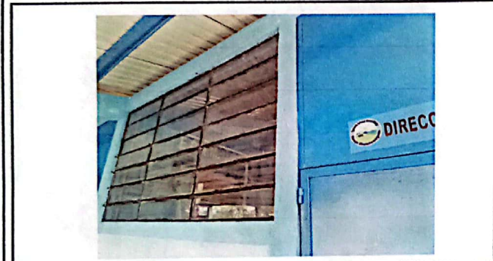
Vista de la ventana de la dirección sin Balcon.