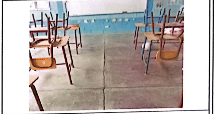
Vista de piso de una de las aulas.