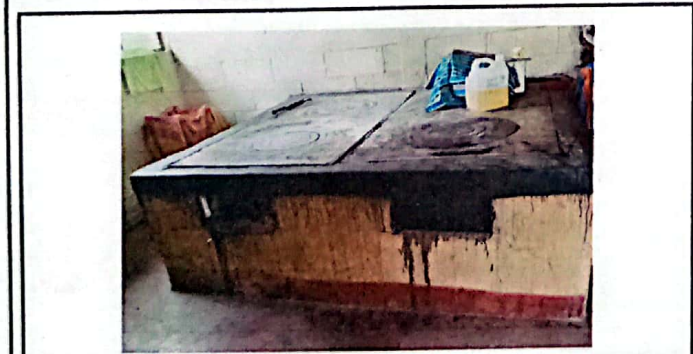
Vista de la plancha rural sin azulejo.