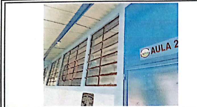
vista de ventanas sin balcón.