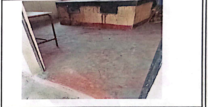
Vista del piso de la cocina.