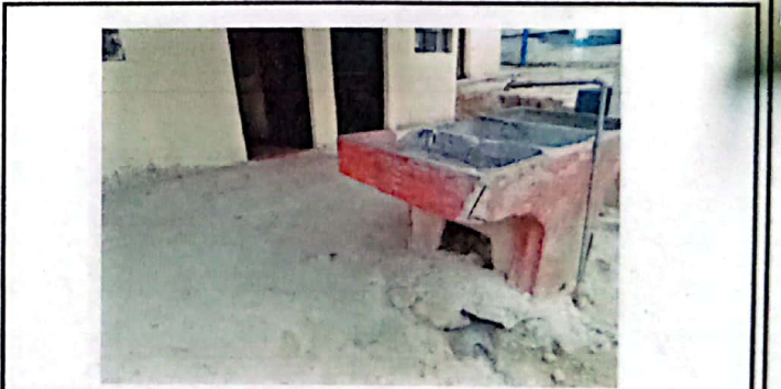
Vista de la pila vieja o antigua.

Observación: Si es necesario se pueden agregar hojas adicionales y actualizar el número de hojas.